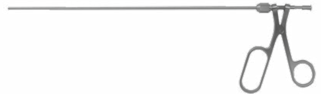
58-6787 Saugstanze für Diskoskop, 330 mm Suction punch for Diskoscope, 330 mm Ø 3,5 mm