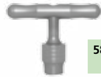
58-6789 T-Handgriff für Trepine T-handle for Trephine