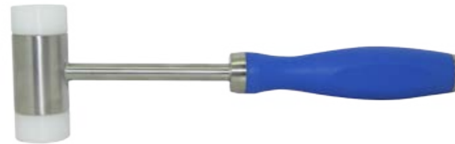
58-6788 Hammer, 230g, Teflon-Kappen, Silikongriff blau Hammer, 230g Teflon caps, silicon handle blue Ø 30 mm x 240 mm